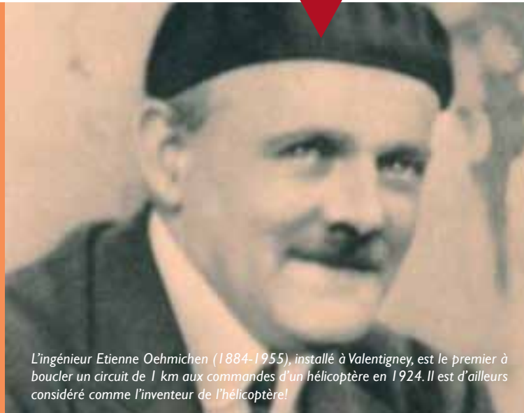
L'ingénieur Etienne Oehmichen (1884-1955), installé à Valentigney, est le premier à boucler un circuit de 1 km aux commandes d'un hélicoptère en 1924. Il est d'ailleurs considéré comme l'inventeur de l'hélicoptère!

Le Pays de Montbéliard vous propose des visites toute l'année sur réservation. Des brochures conçues à votre intention vous sont envoyées sur demande. Les visites peuvent être réalisées en anglais, allemand, italien et langue des signes. Renseignements à l'office de Tourisme.